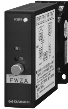
FWZA-□□□□□□□0 (29.5×76×125mm) / 180g